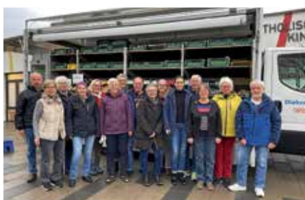
Mitarbeiterinnen und Mitarbeiter bei der Tafel

Die mobile Tafel bedient freitags den westlichen Landkreis Heilbronn. Gestartet wird in Lauffen am St. Paulus Zentrum. Die mobile Tafel, die in der Tafelzentrale Heilbronn mit allerlei Obst, Gemüse und Trockenware befüllt wurde, steht von 9.15–10.30 Uhr in Lauffen, danach fährt die mobile Tafel weiter nach Brackenheim und anschließend nach Güglingen. Die Tafel nutzen dürfen alle Bedürftigen, die einen entsprechenden Tafelausweis besitzen. Beantragen kann man diesen jeden Freitag zu den Verkaufszeiten.