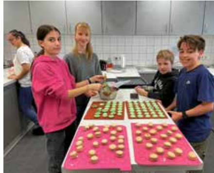
Die Außenstelle Lauffen der Volkshochschule Unterland lud zum Backkurs mit französischem Gebäck ein

hochschule ein Backkurs in der Realschule mit französischen Macarons, Eclairs und Madeleines statt. Lecker, aber nicht einfach herzustellen!