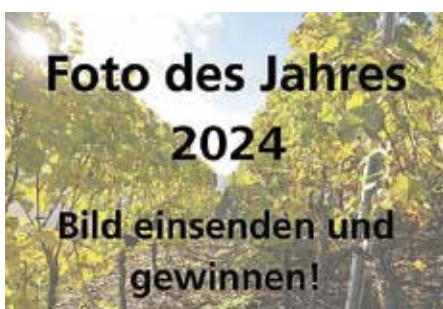
Foto des Jahres 2024

Der Monat März lädt mit seinen Sonnenstunden zum ausgeprägten Fotoshooting ein. Senden Sie uns doch Ihr schönstes März-Foto von Lauffen a.N. ein und senden Sie uns dazu Ihre Teilnahmeerklärung mit. Sie finden diese Erklärung zum Herunterladen auf der Homepage unter der Rubrik Lauffener Bote/Foto des Jahres 2024 oder mit einem Klick hier https://www.lauffen.de/website/de/vlb/foto-des-jahres-2024/https-