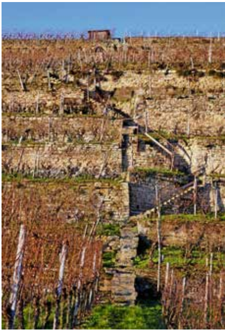
Wettbewerb Foto des Jahres Ulrike Zimmer Steillagen

Lauffen am Neckar ist von schönen Weinbergterrassen umgeben. Landschaftsprägend für den gesamten mittleren Neckarlauf sind die uralten „Mauerleswengert“. Sie sind insbesondere auch kulturhistorisch bedeutsam. Die Wanderung führt vorbei an tiefen Lettenkeupergruben, be-