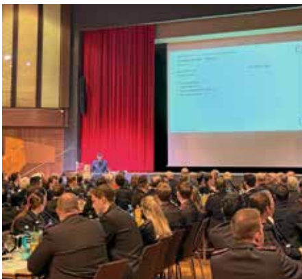
Jahreshauptversammlung der Freiwilligen Feuerwehr Lauffen a.N.