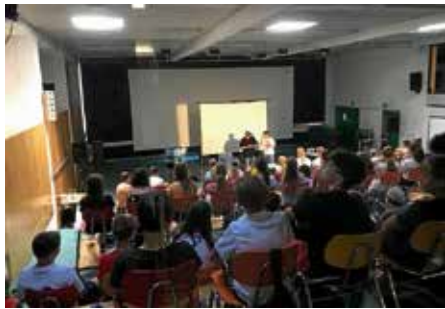
Aufführung „Total vernetzt – und alles klar!“ vom Theater Q-Rage

Ein zentraler Aspekt dieser Zusammenarbeit ist die Präventionsarbeit in verschiedenen Bereichen, darunter Sucht- und Gewaltprävention, Medienprävention und -erziehung, Aufklärung zum Thema Radikalisierung/Wertvorstellungen und Vielfalt, sowie zu Themen der psychosozialen Gesundheit. Im Präventionscurriculum pflegen wir somit eine enge Zusammenarbeit mit unterschiedlichsten Akteuren. Hierbei zählen zum Beispiel die Polizei Heilbronn, das Präventionstheater Q-Rage, sowie eine Vielzahl an Experten anderer Institutionen.