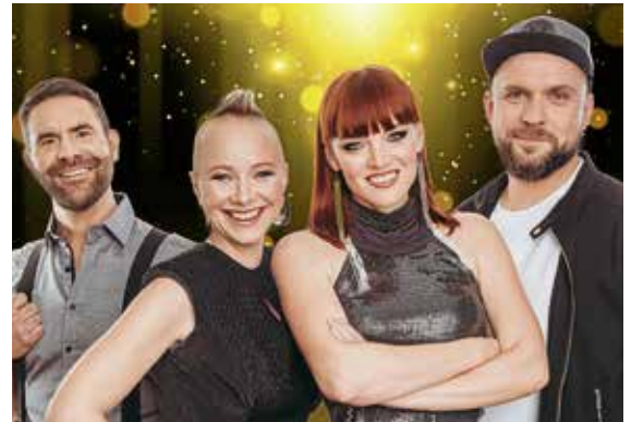
Die A-Cappella-Formation ONAIR verabschiedet sich in diesem Jahr von der Bühne. Mit ihrem Programm „THE VERY BEST!“ ist sie in Lauffen zum letzten Mal zu hören

23. März. „Das, was bleibt.“ nennen sie ihren Streifzug durch die musikalischen Höhepunkte ihres Schaffens der vergangenen vier Jahrzehnte, von „Bilder einer wilden Welt“ bis zum „Hölder“-Rockmusical. Karten für alle Veranstaltungen gibt es unter www.lauffen.de/tickets sowie im Lauffener Bürgerbüro (Tel. 07133/20770).