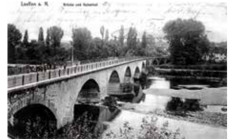
Historisches Foto der Alten Neckarbrücke

bekannt, sondern auch für ihre beeindruckenden Brücken, die den Neckar überspannen. Der Neckar, einer der wichtigsten Flüsse in Süddeutschland, durchquert die Stadt und prägt ihre Landschaft. Die Brücken, die über den Neckar führen, sind nicht nur Verkehrswege, sondern auch architektonisch etwas Besonderes.