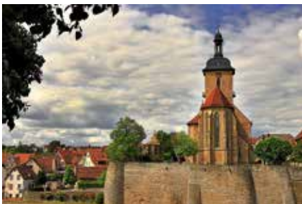
Blick vom Rathaus auf die Regiswindiskirche aus dem Wettbewerb zum Foto des Jahres 2022

Bei dieser Stadtführung gibt es Vieles zu entdecken. Kompakt, spannend und mit dem einen oder anderen „Geschichtle“ erfahren Sie mehr über die Stadt zu beiden Ufern des Neckars. Hüben im „Dorf“ und drüben im „Städtle“ gibt es lauschige Plätzchen mit interessanten Verknüpfungen zur Weltgeschichte, zum Fluss, der die Stadt prägt, und zu den Menschen, die dort ihre Heimat haben. Ob mit Blick von der Rathausinsel (drüben) oder mit Blick von der Regiswindiskirche (hüben) erleben Sie einzigartige Aus- und Einblicke in die wechselvolle Geschichte der Stadt.