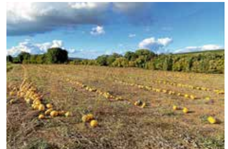
Uwe Milbradt – Kürbisfeld