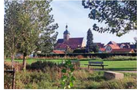
Hans-Peter Schwarz – Blick auf die Regiswindiskirche durch den LamparterPark