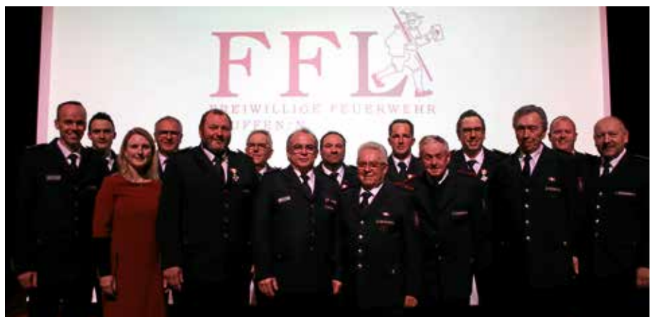
Ehrungen bei der Jahreshauptversammlung der Freiwilligen Feuerwehr Lauffen a.N.

Text: A. Löffler