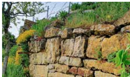
Birgit Sautter – Mauerblümchen