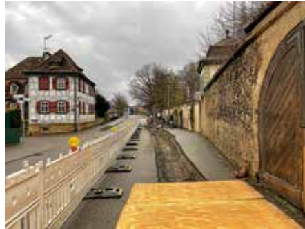
Bauarbeiten für den Fußgängerüberweg in der Nordheimer Straße