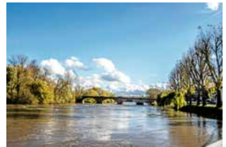
Hansjörg Sept – Der Neckar als wilder Fluss mit Hochwasser