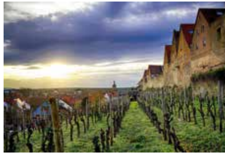
Ulrich Seidel – Abendstimmung im Städtle