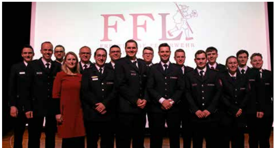
Beförderungen bei der Jahreshauptversammlung der Freiwilligen Feuerwehr 2024