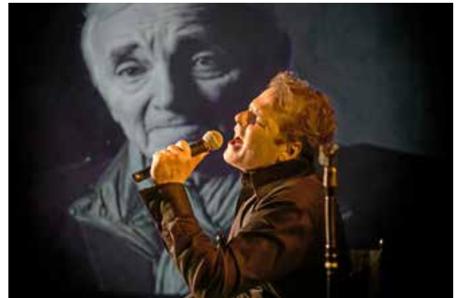
Chansonier Stephan Hippe stellt in einer multimedialen Hommage das Leben des Schauspielers und Sängers Charles Aznavour in den Mittelpunkt.

hört? Wie wurde der kleine Charles zum großen Aznavour? Wer waren seine Freunde, Feinde, Mitstreiter? „CHARLES“ ist eine musikalische Biografie mit den schönsten Liedern, Geschichten und virtuellen Duetten von und mit Aznavour und seinen Komplizen. Persönliche unveröffentlichte Erinnerungen der Familie Aznavour runden das opulente Theater-Solo ab. Eine Geschichte, größer als das Leben.