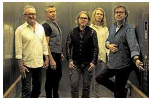
„Das, was bleibt“ nennt die Rockband „Hölders Welt“ das Konzert mit Lieblingsliedern aus 4 Jahrzehnten.

sich auf ein abwechslungsreiches Festival der großen und kleinen Momente – eine emotionale Achterbahnfahrt beim Blick zurück auf 10 überaus erfolgreiche gemeinsame Jahre.