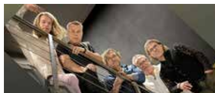
Die Rockband „Hölders Welt“ umrahmt die Ehrungen musikalisch und gibt mit mehreren Songs einen kleinen Einblick in ihr Programm „Das, was bleibt“

Im Rahmen einer Feierstunde werden am Dienstag, 27. Februar 2024, um 19 Uhr im Lauffener Klosterhof, Klosterhof 4, die erfolgreichen Sportlerinnen und Sportler aus dem vergangenen Jahr 2023 für ihre herausragenden sportlichen Leistungen und Erfolge geehrt. Ebenso werden an diesem Abend zudem die langjährigen Blutspenderinnen und Blutspender geehrt. Saalöffnung ist um 18.30 Uhr.