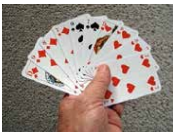
Skat- und Binokelturnier

In der Städtischen Begegnungsstätte für Ältere „mittel.punkt“ in der Bahnhofstr. 27 wird jeden Montag neben anderen Spielen auch Skat und Binokel gespielt. Dazu kommen jeden Montag ca. 12 Personen zum Skat- und Binokelspiel.