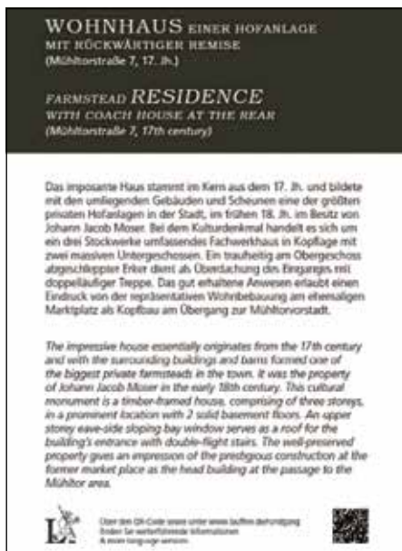
Beispiel einer Gebäudetafel am sanierten Kulturdenkmal Mühltorstraße 7

Dank einer erneuten großzügigen Spende des Heimatvereins ( http://www.heimatverein-lauffen.de ) von 4.000 Euro konnten weitere 36 historische Gebäude – zumeist Kulturdenkmale – im Städtle und in der Altstadt rund um die Regiswindiskirche mit Gebäudetafeln versehen werden. Die Tafeln bieten Informationen zur Geschichte und zum Alter der Gebäude in einer deutschen und englischen Version, zusätzlich sind über einen QR-Code weitere Informationen und eine französische Version unkompliziert im Internet abrufbar.