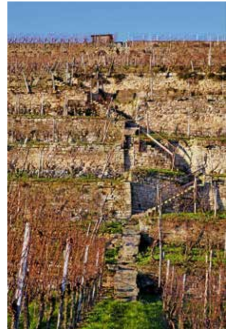
Wettbewerb Foto des Jahres Ulrike Zimmer Steillagen

um 14 Uhr am Parkplatz 6 „Hagdol“, Nordheimer Str., 74348 Lauffen.