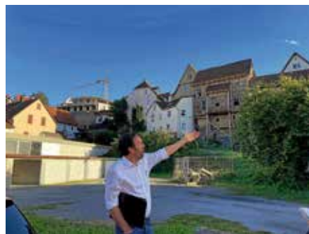
Vor Ort bestand die Möglichkeit zur Diskussion und Information.

Es ist erfreulich, dass die Aufnahme in das Landessanierungsprogramm mit seinen hervorragenden Fördermöglichkeiten so schnell gelingen konnte. Die privaten Eigentümer im Gebiet sind aufgerufen, diese große Chance zu nutzen und mit Hilfe der Fördermittel, die zu 60 % vom Land und zu 40 % von der Stadt übernommen werden, Sanierungsmaßnahmen durchzuführen. Neben den geplanten städtischen Maßnahmen wie z. B. Kindergarten- und Straßensanierung kommt es vor allem auf die Bereitschaft der privaten Gebäudeeigentümer zu Investitionen in die historische Gebäudesubstanz an, um das Sanierungsverfahren zum Erfolg zu führen.