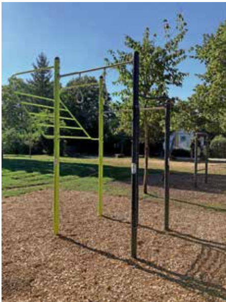
Die Anlage bietet weitere Möglichkeiten für gesunden Outdoor-Sport.

Nun wurde das Angebot in Form einer Mini-Calisthenicsanlage durch eine weitere Spende der Bürgerstiftung komplettiert.