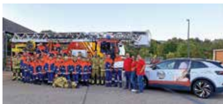
Spendenübergabe an die Jugendfeuerwehr