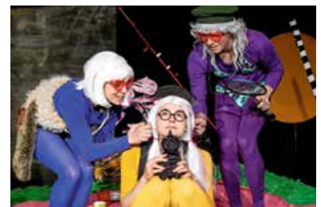
Die Württembergische Landesbühne Esslingen spielt am Sonntag, 22.10., „Das NEINHorn“ nach dem kultigen Kinderbuch von Marc-Uwe Kling in der Lauffener Stadthalle.

„Das NEINHorn“ ist eines der neuesten Kinderbücher des Stuttgarter Liedermachers und Kabarettisten Marc-Uwe Kling (*1982), bestens bekannt für seine „Känguru-Chroniken“. Mit „Das NEINHorn“ hat Kling ein Fest der Phantasie und der Sprachspielerei erdacht, das Große wie Kleine verzaubert.