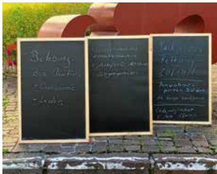
Während des Rundgangs wurden Ideen für die Planungsworkstatt festgehalten

Mit der Auftaktveranstaltung in der Alten Kelter wurde bereits am 28. Juni der Startschuss für die Vorbereitung des Sanierungsgebietes gegeben, das ab kommendem Frühjahr für die kommenden 8 bis 10 Jahre für viele neue Impulse im Städtle sorgen soll.