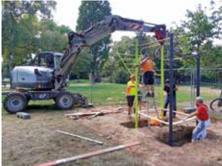
Das routinierte Bauhof-Team beim Aufbau der Anlage.

Seit einiger Zeit befinden sich im hinteren Teil des Spielplatzes neben dem Beachvolleyballfeld vier Erwachsenen-Sportgeräte (gespendet von der Bürgerstiftung), die sehr gut von Jung und Alt angenommen werden und dadurch zu einer echten Bereicherung am Kiesplatz geworden sind.