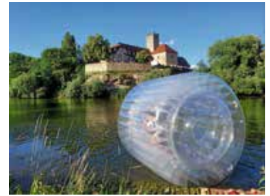
Zorb auf dem Neckar

Derweil zogen die Superzwerge der Zwergenmucke mit ihrem Mitmachkonzert für die Kleinen, aufgrund der hohen Temperaturen von der ZEAG-Energie Jugendbühne in den Schatten des Schotterparkplatzes. Wer beim Konzert nicht mitmachen wollte, konnte entweder auf der angrenzenden Wiese mit dem CVJM Weinkisten stapeln oder über den Spielzeugflohmarkt schlendern. Abkühlung konnte man aber auch auf dem Altarm des Neckars finden. Dort konnte man Kanu fahren oder mit einem Zorb über den Neckar laufen.