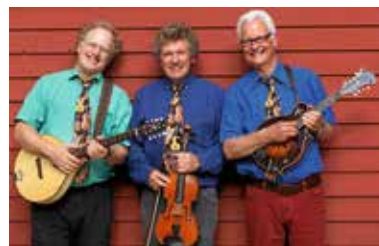
Bei „Matching Ties“ sind drei der führenden Folk-Musiker der europäischen Szene in einer Band versammelt.

Wein oder Secco begleitet von leckeren Snacks der Bäckerei Schuler.