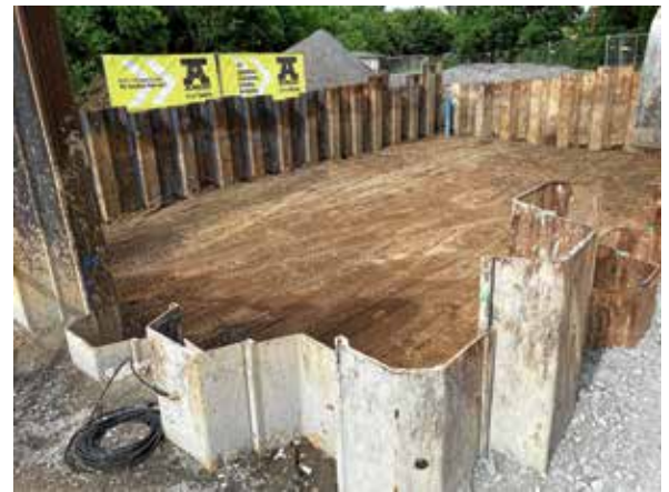
Die Baugrube mit Spundwandverbau ist vorbereitet.

Das bestehende Pumpwerk, ein unscheinbarer Klinkerbau hinter der sog. ZEAG-Scheune, stammt aus den 1960er-Jahren und ist nicht mehr sanierungsfähig. Daher wird für die Sicherstellung einer zukunftsfähigen und dem Stand der Technik entsprechenden Abwasserentsorgung der Neubau des Pumpwerks erforderlich. Dieses hat die Aufgabe, das im Städtle und der östlich des Neckars gelegenen Stadtbereiche anfallende Abwasser über die alte Neckarbrücke in Richtung Hauptpumpwerk Kies zu befördern. Von dort gelangt das gesamte städtische Abwasser zur Reinigung in die Kläranlage.