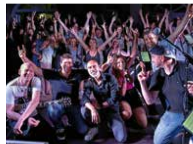
STEFLEX in der Alten Kelter