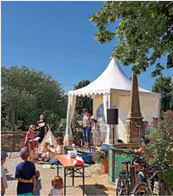
Ökumenischer Familiengottesdienst am Brückenfestsonntag

Der Sonntag startete mit einem ökumenischen Gottesdienst im Burghof der Rathausburg. Am Nachmittag lockte der Katzenbeißer Cup, der traditionelle Spaßtriathlon, viele Besucher auf die alten Neckarbrücke bis runter zum Altarm. Insgesamt sieben Teams traten an. Zwei davon waren Jugendmannschaften.