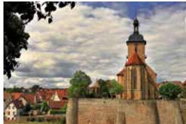
Regiswindiskirche Foto: Frank-M. Zahn aus dem Wettbewerb zum Foto des Jahres

Diese öffentliche Führung zeigt den Gästen Orte und schildert Ereignisse, die eng mit den Personen Hölderlin und Regiswindis verbunden sind. Friedrich Hölderlin: Der berühmte, 1770 in Lauffen geborene Dichter und Philosoph. Das siebenjährige Mädchen Regiswindis: Nach dem gewaltsamen Tod im Jahre 839 stieg sie um 1000 zur Ortsheiligen auf. Beide Personen haben die Entwicklung von Lauffen bis in die heutige Zeit maßgeblich geprägt.