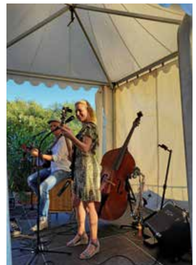
Double Tree auf dem Burghof

Derweil zogen die Superzwerge der Zwergenmucke mit ihrem Mitmachkonzert für die Kleinen, aufgrund der hohen Temperaturen von der ZEAG-Energie Jugendbühne in den Schatten des Schotterparkplatzes. Wer beim Konzert nicht mitmachen wollte, konnte entweder auf der angrenzenden Wiese mit dem CVJM Weinkisten stapeln oder über den Spielzeugflohmarkt schlendern. Abkühlung konnte man aber auch auf dem Altarm des Neckars finden. Dort konnte man Kanu fahren oder mit einem Zorb über den Neckar laufen.