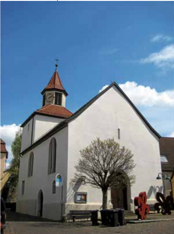
Martinskirche im Städtle

Die heutige evangelische Martinskirche im „Lauffener Städtle“ am rechten Neckarufer wurde um 1200 ursprünglich als Nikolauskapelle erbaut – zeitgleich mit der Gründung des „Städtle“. Nach der Reformation (1517) verfiel die Kirche zusehends bis sie nach einer Renovierung im Jahre 1884 als Martinskirche geweiht und neu belebt wurde.