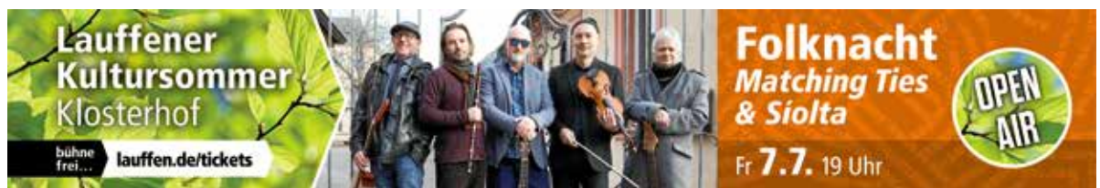
Der Kultursommer 2023 startet wieder mit einer Folknacht