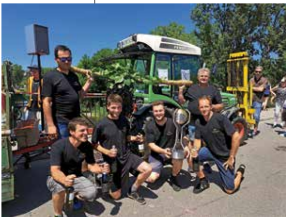
Stäffleskämpfer nach der Siegerehrung zum Katzenbeißer-Cup

Der Sonntag startete mit einem ökumenischen Gottesdienst im Burghof der Rathausburg. Am Nachmittag lockte der Katzenbeißer Cup, der traditionelle Spaßtriathlon, viele Besucher auf die alten Neckarbrücke bis runter zum Altarm. Insgesamt sieben Teams traten an. Zwei davon waren Jugendmannschaften.