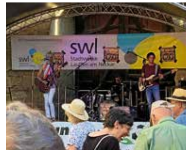
the Gimicks – koi normale SFL Band