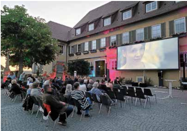
Open-Air-Kino 25.05.2023 auf dem Burghof

Es war ein erster wunderbarer Frühsommerabend und über 50 Besucher sind am vergangenen Donnerstag auf den Burghof zum Open-Air-Kino gekommen. Das Wetter war perfekt, das Ambiente auf dem Burghof einfach schön.