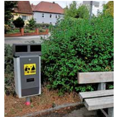
Eine von 56 Hundekotstationen im Stadtgebiet und Außenbereich.

Weitergehende Auskünfte zur Hundehaltung erteilt gerne das Ordnungsamt im Bürgerbüro Lauffen a.N., Tel. 07133/20770.