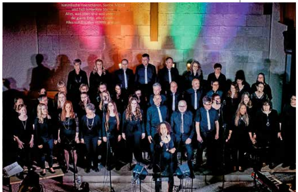
chorAL, der christliche Popchor der „Ev. Allianz“ singt „MESSIAH“ (Chorsängerinnen)

„Messiah“ besteht aus Titeln in Qualität und Stil, für die der Oslo Gospel Choir bekannt ist. Die biblischen Geschichten werden musikalisch vielfältig in Szene gesetzt und durch Textpassagen übergeleitet: Diese Mischung macht den einzigartigen Reiz des Musicals aus. Von Pop bis Country, von Gospel bis Rock, von Swing bis Folk. Vorgetragen von dem christlichen Popchor der Evangelischen Allianz chorAL, Solisten aus den eigenen Reihen und