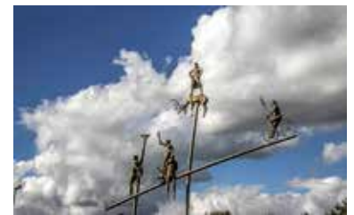
Hölderlin-Skulptur Foto: Hansjörg Sept aus dem Wettbewerb zum Foto des Jahres 2022

Sonntagsführung am 11. Juni um 15 Uhr: Das „Hölderlin-Quartier“