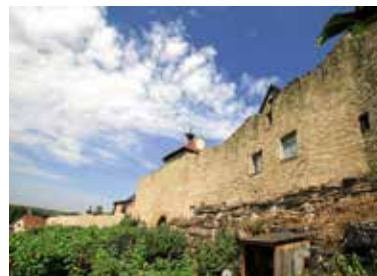
Altes Heilbronner Tor

Führung im Lauffener Städtle am Samstag, 10. Juni um 15 Uhr