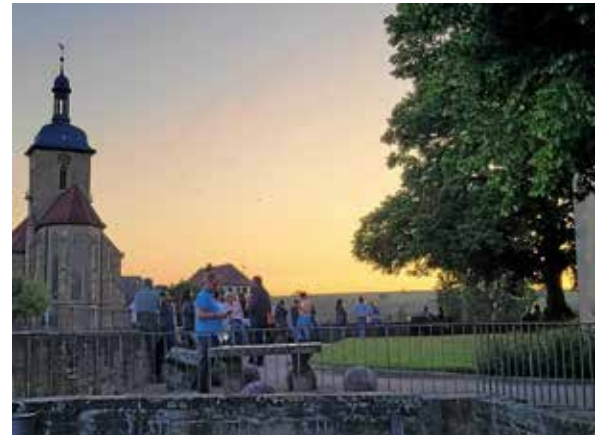
Open-Air-Kino 25.05.2023 auf dem Burghof

Mit der Beziehungskomödie „Einfach mal was Schönes“ von und mit Caroline Herfurth, startete die Open-Air-Kino Saison in Lauffen a.N. auf dem Burghof. Bewirtet hat das Hofcafé Hölderlinhaus.