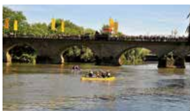
Katzenbeißer Cup 2017

Aus organisatorischen Gründen können maximal 16 Mannschaften an dem Wettbewerb teilnehmen. Der Wettkampf erfolgt in Läufen mit zwei Mannschaften.