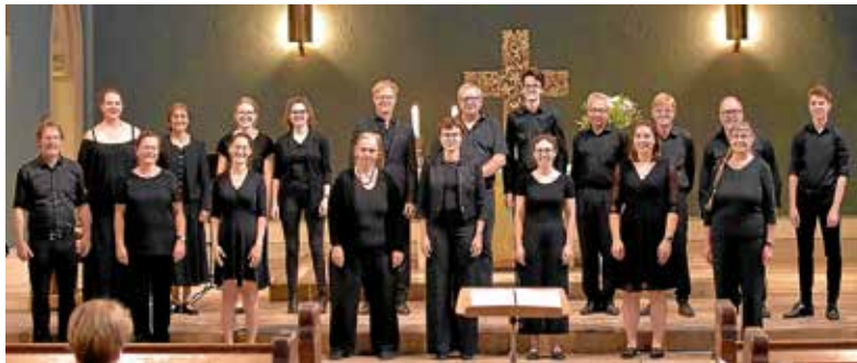
Das Vokalensemble „alto e basso“ bringt das Thema „Hoffnung“ zum Klingen.

Beim Konzert am 20. Mai in der Lauffener Regiswindiskirche stehen u. a. Chorwerke von Gluck, Brahms, Elgar und Christoph Enzel auf dem Programm