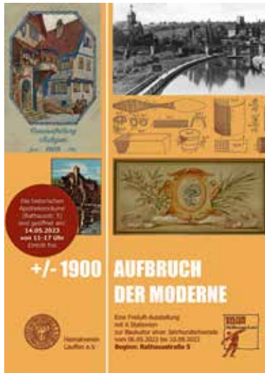
Aufbruch der Moderne

Im Rahmen der Freiluftausstellung des Heimatvereins „+/- 1900 – Aufbruch der Moderne“ (6. Mai–