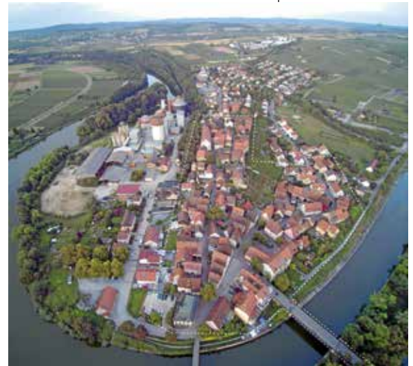
Drohnenaufnahme vom Städtle

Am Informationsstand der Stadtverwaltung und des Sanierungsträgers „die STEG StadtentwicklungGmbH“ auf dem Sonnenplatz in der Heilbronner Straße gibt es eine Plakatausstellung zum Sanierungsverfahren und einen Ausblick, wie es im zweiten Halbjahr mit den vorbereitenden Untersuchungen weitergehen soll. Angedacht sind gemeinsame Gebietsrundgänge, Bürgerwerkstätten und Umfragen zur Ermittlung der Mitwirkungsbereitschaft. Ebenfalls besteht die Möglichkeit für Eigentümerinnen und Eigentümer, sich vorab über Fördermöglichkeiten im künftigen Sanierungsgebiet zu informieren. ■