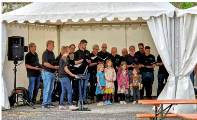
Urbanus After Work Session

„Kein schöner Land“, zwei gemeinsam gesungene Kanons, nebst „Angels“, „Über sieben Brücken musst du gehn“, „Marmor, Stein und Eisen bricht“ und „Über den Wolken“, sorgten im Zelt für ein heiteres Zusammenhocken (Session). Danach war der Himmel wieder offen und der Abend fand einen genüsslichen Fortgang und Ausklang bei vorzüglichen Weinen. ■