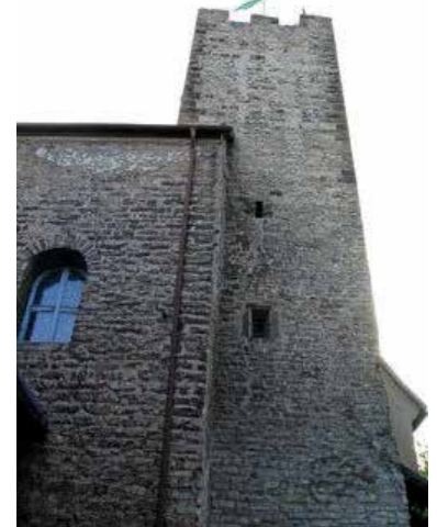
Mauern des Rathausturmes

des Reiches ein einflussreiches Adelsgeschlecht im Neckartal von Lauffen bis hin nach Heidelberg. Start zur Führung ist um 15 Uhr. Sie dauert rund 90 Minuten und geht durch das Museum und die Burg.