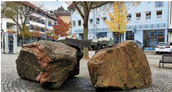
Brunnen am Postplatz

„Die Stadt Lauffen vom Bahnhof aus entdecken“