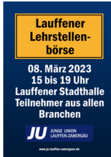
Plakat Lauffener Lehrstellenbörse 2023

Möglichkeit eröffnet, sich über Ausbildungsberufe und Studiengänge zu informieren und somit den ersten eigenständigen Schritt in ihre Zukunft zu wagen.