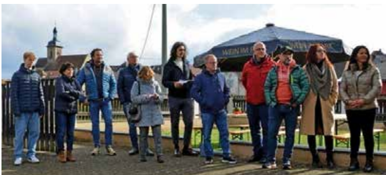
Zahlreiche Interessierte aller Generationen schauen sich die Jugendwerkstatt am Eröffnungstag an.