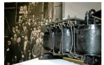
Altes Foto der Drehstromübertragung Lauffen – Frankfurt vor über 100 Jahren