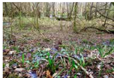
Szilla Blüte im Kaywald aus dem Wettbewerb zum Foto des Jahres 2019

nen uns in diesem Naturschutzgebiet noch andere botanische Besonderheiten. Treffpunkt: Umspannwerk im Brühl in Lauffen, 9 €/Erw., 4 €/Kind ab 8 Jahre. Anmeldung bei Ilse Schopper unter Tel. 07046/4073176 oder i.r.schopper@gmx.de.