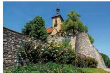
Regiswindiskirche mit Kapelle im Vordergrund

Diese öffentliche Führung zeigt den Gästen Orte und schildert Ereignisse, die eng mit den Personen Hölderlin und Regiswindis verbunden sind. Friedrich Hölderlin: Der berühmte, 1770 in Lauffen geborene Dichter und Philosoph. Das siebenjährige Mädchen Regiswindis: Nach dem gewaltsamen Tod im Jahre 839 stieg sie um 1000 zur Ortsheiligen auf. Beide Personen haben die Entwicklung von Lauffen bis in die heutige Zeit maßgeblich geprägt.