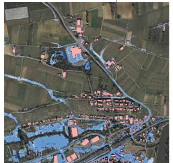
Abbildung 8: Übersicht der Überflutungstiefen in dem Bereich Dorf bei einem außergewöhnlichen Ereignis

Von Bürgermeister Waldenberger wurde die Kenntnisnahme des Konzepts und die anstehende Öffentlichkeitsbeteiligung vorgeschlagen. Dies wird vom Gemeinderat einstimmig beschlossen.