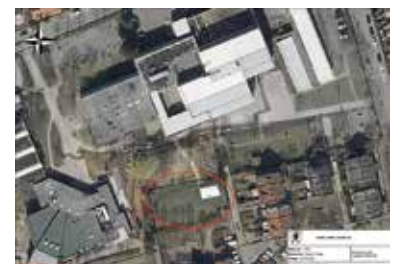
Neubau Kernzeit/Hort Hölderlin Grundschule

hier: Neubau Kernzeit/Hort Hölderlin-Grundschule, Planungsbeauftragung