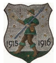
Lauffener Benagelungszeichen

Eintritt frei für Lauffener Einwohner (ansonsten 4 €)