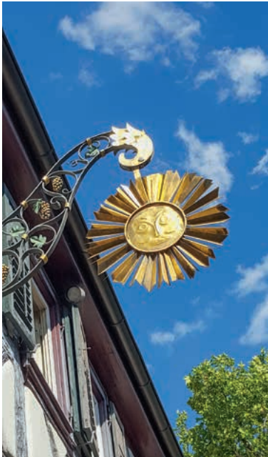
Gaststättenschild Sonne, Stättle

Letztmalig: Führung „Gastlichkeit an jedem Eck“ am Sonntag, 23. Oktober um 14 Uhr – Ein Spaziergang zum Erinnern und Mitmachen