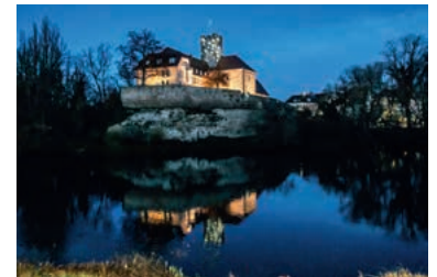
aus dem Wettbewerb zum Foto des Jahres 2021

Der Gemeinderat fasste bei sieben Gegenstimmen und zwei Enthaltungen den Beschluss, auf die Beleuchtung der Bäume entlang der Kiesuferstraße zu verzichten.