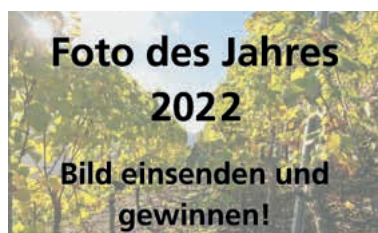
Foto des Jahres 2022

Senden Sie uns Ihr Lieblingsfoto/ Ihre Lieblingsfotos ein, die im jeweiligen Monat aufgenommen wurden. Nutzen Sie die Tage im Oktober für Ihr besonderes Foto von Lauffen a.N.