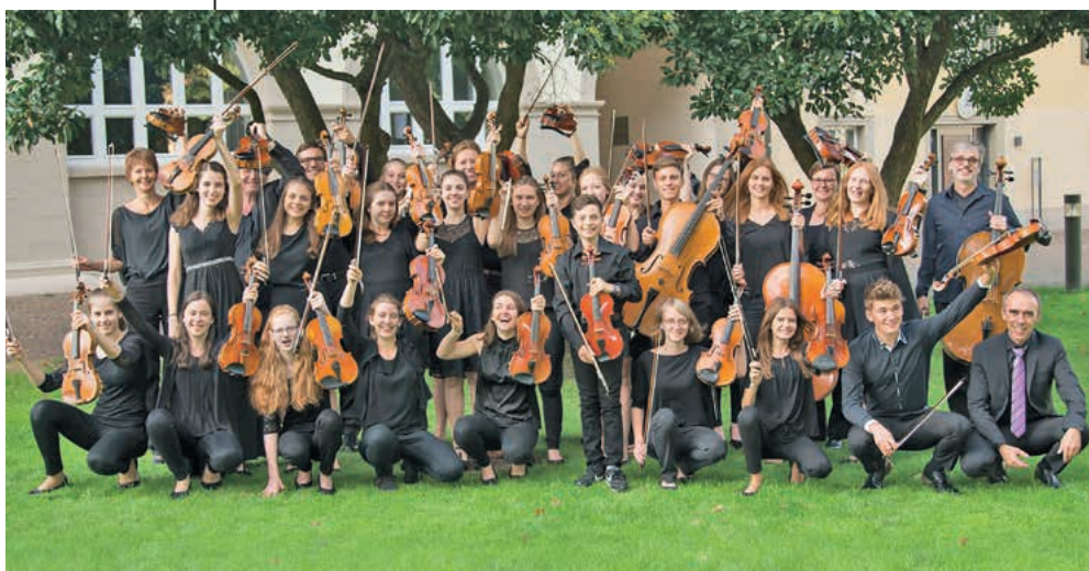
Die größten Streicher- talente der Region: Das Junge Kammer- orchester Tauber- Franken

Junges Kammerorchester Tauber-Franken am 10. September und Die Magier am 22. September in der Stadthalle