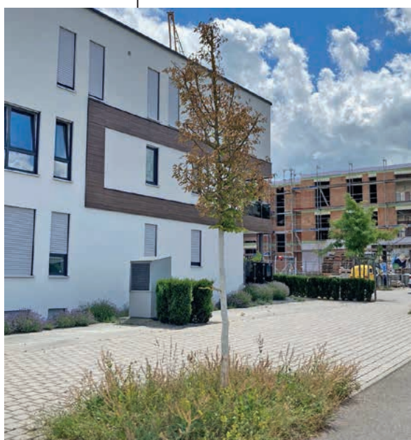
Ein junger Straßenbaum mit Trocken-schäden in der Schillerstraße.

Unsere Bäume an den Straßenrändern und den Grünanlagen prägen das Gesicht unserer Stadt. Nicht nur das: Bäume spenden Schatten und sie tragen zur Kühlung in dieser aufgeheizten Jahreszeit