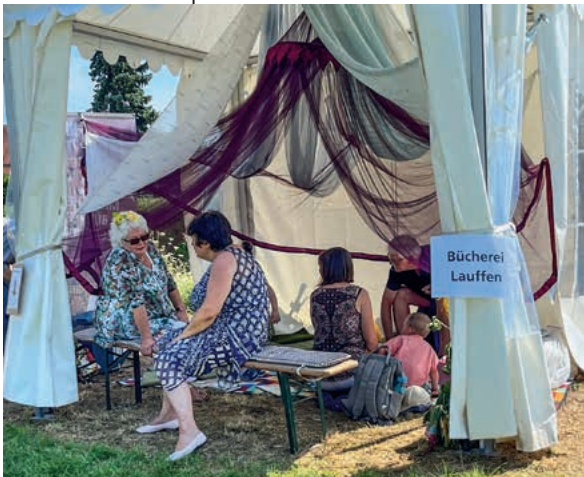
Aber auch ruhige Angebote gab es, genau richtig zum Durchschnaufen bei den hohen Temperaturen, so wie hier bei der Bücherei Lauffen .