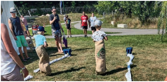
Auch beim Sackhüpfen ging die Post ab. Hier lieferten sich die Kinder immer wieder spannende Wettrennen.

man sich beim Schützenverein , trotz großer Hitze, in Konzentration üben.