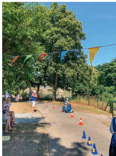
Foto und Text 1–8: Bettina Keßler Foto und Text 9–12: Robin Eichhorn Foto 13–17: Sabine Gibler Foto 18: Gerald Rutz