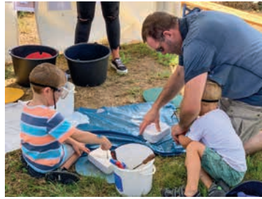
Im Zelt des Naturkindergartens konnten Ytong Steine bearbeitet werden.

man sich beim Schützenverein , trotz großer Hitze, in Konzentration üben.