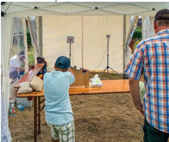
Um mit dem Lichtgewehr oder der Lichtpistole etwas zu treffen, musste

Die Stadtverwaltung bedankt sich ganz besonders bei allen Vereinen, Kirchengemeinden und Organisationen, die mit ihren Auftritten, Beiträgen und Spiel-Angeboten zu einem gelungenen Kinderfest beigetragen haben sowie allen ehrenamtlich Engagierten vor und hinter den Kulissen. Die Stadt dankt zudem dem DRK, der DLRG sowie den Mitarbeitern des Ordnungsamts und Kommunalen Ordnungsdienstes, die mit der Security für einen sicheren Ablauf des Festes gesorgt haben. Ein großes Dankeschön geht zudem an die Mitarbeitenden des Bauhofs und der Kläranlage für Aufbau, Abbau und Betreuung der ganzen Fest-Infrastruktur. Und schließlich ein herzlicher Dank an das Orga-Team aus Büro Bürgermeister und Bürgerbüro für die Vorbereitung und Durchführung des Festes.