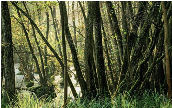
Der Wald – sagenumwoben und zauberhaft – steht im Mittelpunkt der Lesung von Ulrike Kieser-Hess und einer Lauffener Märchenerzählerin.

Vor der wunderbaren Waldkulisse des Forchenwalds gibt es Sagen aus dem Zabergäu