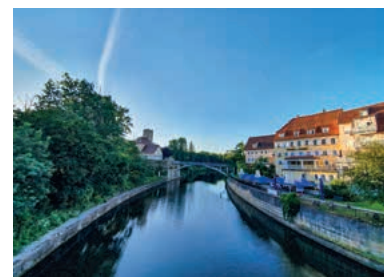
aus dem Wettbewerb zum Foto des Jahres 2021

Kein Bächlein, nein ein richtiger Fluss bestimmt das Stadtbild von Lauffen und hat Auswirkungen auf das gesamte Umland. Der Neckar, mit Ursprung im Schwarzwald, hat schon einige Kilometer hinter sich, wenn er in Lauffen ankommt. Was macht den Neckar aus? Welchen Einfluss hat er auf die Landschaft und die Menschen, die hier wohnen – damals und heute?