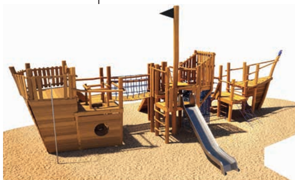
Das neue Spielschiff dient als Ersatz für die alte Kletterspinne.

Bis Ende Mai noch Möglichkeit für Spenden