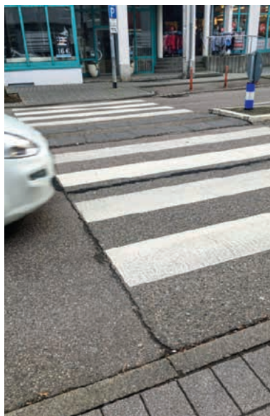
Die Bordsteine an den Zebrastreifen in der Bahnhofstraße sind zu tief, normgerecht wäre eine Querung mit Richtungs-, Aufmerksamkeits- sowie Sperrfeld.

Ziel der Begehungen war die Bestandsaufnahme und Identifikation von Barrieren für mobilitätseingeschränkte Personen und Senioren im öffentlichen Raum zwischen Bahnhof und Postplatz. Dabei sind diverse Defizite bezüglich der Barrierefreiheit aufgefallen, die zum Teil auch schon behoben werden konnten. Ein großes Projekt zur Barrierefreiheit, das dieses Jahr fertiggestellt wird, sind die neuen Bahnhofsaufzüge sowie die barrierefreie Gestaltung des Busbahnhofs und weiterer Haltestellen, die ebenfalls für 2022 vorgesehen sind. Außerdem werden die Belange der Barrierefreiheit bei allen neuen Maßnahmen berücksichtigt. Dennoch bleibt vor allem im Bestand noch viel zu tun, um eine zufriedenstellende Barrierefreiheit zu erreichen.