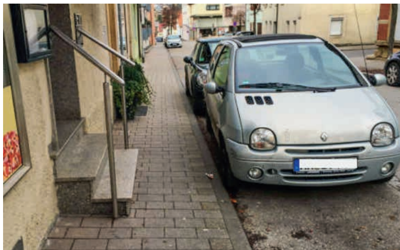
Der Gehweg Richtung Seugenstraße ist sehr schmal (durch Parkbuchten), zwei Personen können nicht nebeneinander gehen.

Der Lauffener Gemeinderat hat daher für eine systematische Herangehensweise die Beauftragung eines externen Ingenieurbüros (Modus Consult) mit einer Leitplanung zur Barrierefrei-