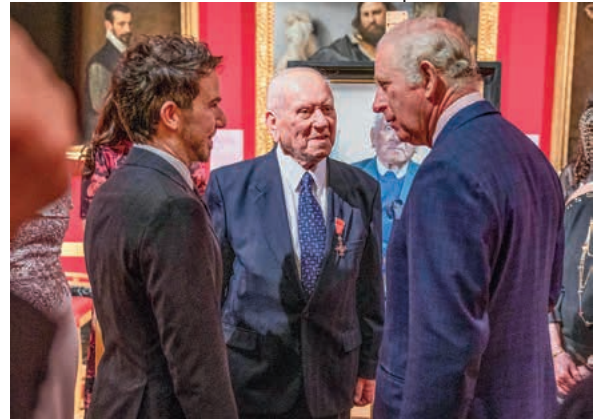
Holocaust-Überlebende Arek Hersh mit Prince Charles u. dem Künstler Massimiliano Pironti

Das Hölderlinhaus gratuliert Massimiliano Pironti zu dieser besonderen Ehre! Für den Dreh in Stuttgart für die SWR-Sendung „Kunscht!“ wurde das Hölderlin-Porträt als Werk mit Regionalbezug hinzugenommen. Der Beitrag wird im SWR-Fernsehen am 17.02. um 22.45 Uhr unter dem Titel „Gemälde für Prinz Charles – der Stuttgarter Künstler Massimiliano Pironti und seine Ölportraits“ ausgestrahlt. Informationen zu diesem besonderen Ereignis und zum Künstler