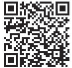
QR-Code zur Projektseite