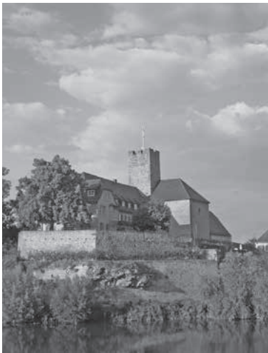
Gästeführer Gerhard Kuppler bietet im Rahmen der „Lauffener Sonntagsführungen“ am 5. September zwei Führungstermine für die Grafenburg an.

Sonntag, 5. September zwei öffentlichen Führungen durch die Grafenburg