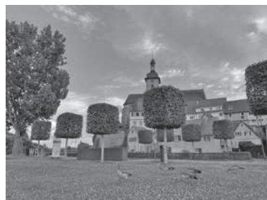
aus dem Wettbewerb zum Foto des Jahres 2020

Diese öffentliche Führung zeigt den Gästen Orte und schildert Ereignisse, die eng mit den Personen Hölderlin und Regiswindis verbunden sind.