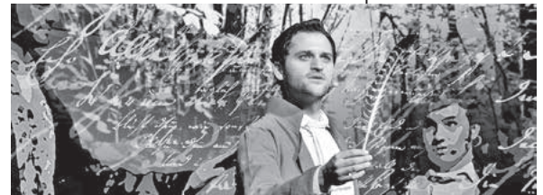
Bei „Hölderlin on Stage“ begegnen Hölderlins Gedichte dem Rockmusical „Hölder“.

Hölderlin on Stage am 31. Juli & 1. August