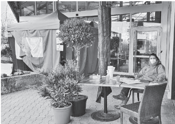
Teststelle beim Pflanzen-Mauk

Am Freibad werden am kommenden Wochenende von Freitag bis Sonntag jeweils von 12 bis 17 Uhr Schnelltest für alle BürgerInnen angeboten. Zusätzlich auch kostenpflichtig PCR-Tests.