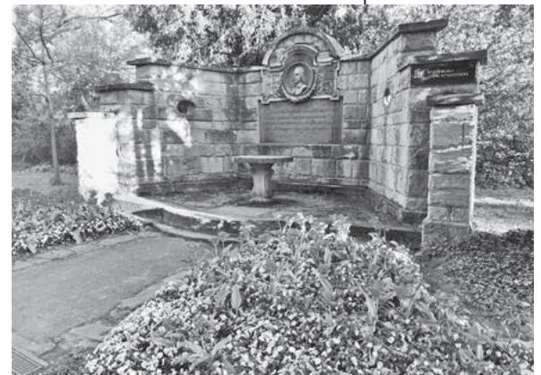
Foto: Hans-Peter Schwarz, aus dem Wettbewerb zum Foto des Jahres 2019

Kreisverkehr“. Dann geht's über das Hölderlin-Denkmal zum Hölderlinhaus, welches von außen bzw. im Innenhof präsentiert wird.