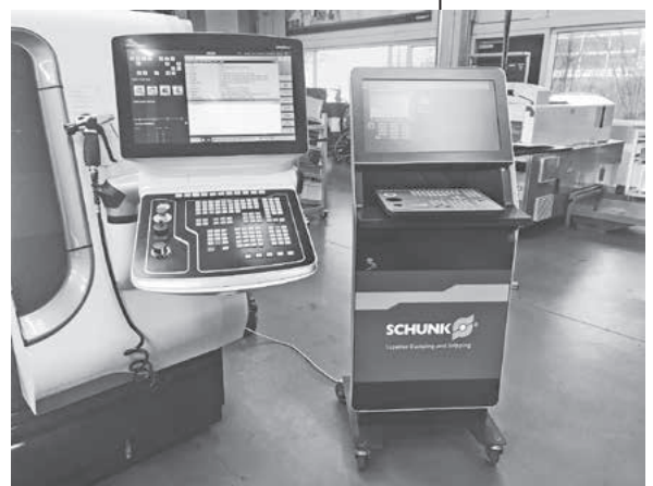
Digitale CNC-Maschine und ihr digitaler Zwilling

Die digitalen Zwillinge kommen nun in der Ausbildung zum Einsatz. Durch die vier zusätzlichen Maschinen können mehr Azubis an ihrer eigenen Maschine arbeiten, anstatt sich CNC-Maschinen zum Üben zu teilen. Dank der virtuellen Kopien lernen die Auszubildenden zudem frühzeitig im realen Umfeld, ohne Angst vor Fehlern haben zu müssen. Denn selbst bei einer Fehlprogrammierung kann hier kein Schaden entstehen. Passt mit dem am digitalen Zwilling simulierten Programm alles, kann es später auf die reelle Maschine übertragen werden. Die mobilen digitalen Kopien ermöglichen auch das gegenseitige Lernen: Stehen CNC-Maschine und digitaler Zwilling nebeneinander, kann der fortgeschrittene Azubi an der CNC-Maschine dem Anfänger an der digitalen Kopie bei der Programmierung helfen, ohne immer gleich den Ausbilder hinzuziehen zu müssen.