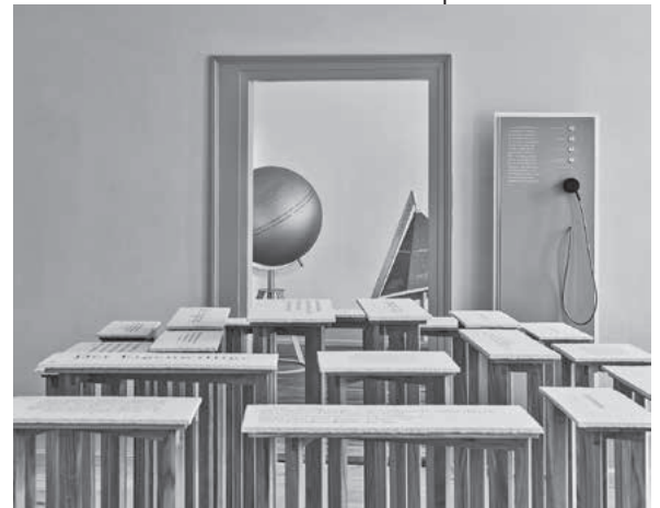
Die Ausstellung im Hölderlinhaus ist ab 20. März wieder geöffnet.

Das Burgmuseum ist ab Montag, 22. März, zu diesen Zeiten für Sie