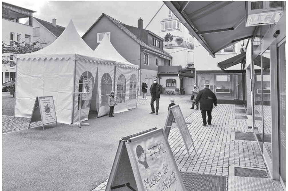
Teststelle am Platanenplatz bietet ab sofort auch kostenfreie Tests für die Bürgerschaft.

Testungen nach §4a der TestV können nach §5 der TestV im Rahmen der Verfügbarkeit von Testkapazitäten mindestens einmal pro Woche