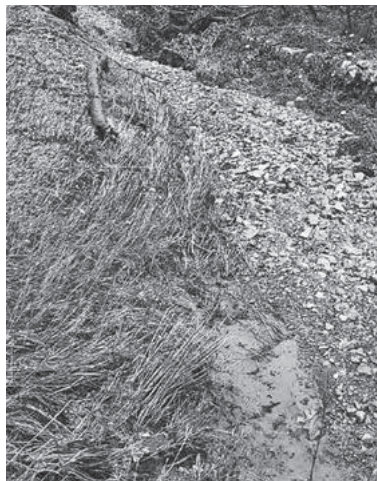
Starkregen am 09.06.2018 oberhalb der Konstenklinge mit starken Ausschwemmungen an Wegen

Treten Überflutungen infolge von Starkregen auf, spricht man von sogenannten „Sturzfluten“. Diese Sturzfluten weisen hohe Fließgeschwindigkeiten auf und überfluten nicht nur Häuser und Straßen, sondern erodieren auch unterschiedlichstes Material (beispielsweise Gehölz, Sediment) entlang ihres Fließweges. Durch die Sedimentfracht beziehungsweise das Treibgut verstärkt sich die zerstörerische Kraft der Wassermassen.