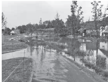
Überfluteter LamparterPark im Mai 2019

Zunächst ist es wichtig, sich darüber bewusst zu sein, dass Hochwasser und Hochwasser infolge von Starkregenereignissen jeden treffen können. Selbst wenn sich der Wohnsitz nicht in unmittelbarer Nähe eines Flusses befindet, besteht dennoch das Risiko, Schaden durch Folgen von Hochwasser oder Starkregen zu nehmen. Das Wasserhaushaltsgesetz (§ 5 Abs. 2 WHG) regelt daher, dass jede potenziell vom Hochwasser betroffene Person „[...] im Rahmen des ihr Möglichen und Zumutbaren verpflichtet [ist], geeignete Vorsorgemaßnahmen [...] zu treffen [...].“