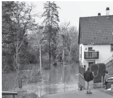
Dammstraße: Kleineres Hochwasser in der Dammstraße im Januar 2015

Jede Bürgerin beziehungsweise jeder Bürger sollte deshalb anhand der sogenannten Hochwassergefahrenkarten prüfen, inwieweit das eigene Haus beziehungsweise die eigene Wohnung betroffen ist. Die Karten zeigen auf, welche Flächen wie oft von Hochwasser betroffen sind und wie hoch das Wasser bei dem jeweiligen Hochwasserszenario steht. Die Karten können u. a. im Internet unter https://udo.lubw.baden-wuerttemberg.de eingesehen werden.