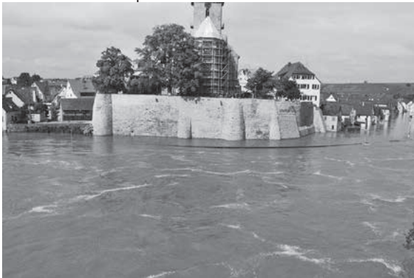
Juni 2013: Das letzte große Hochwasser in Lauffen im Juni 2013

Wer sich in Sicherheit wiegt, weil er glaubt, Hochwasserschutz sei Aufgabe der Kommune, und diese hätte schon in „ausreichendem“ Umfang Schutzmaßnahmen umgesetzt, sollte bedenken, dass ein absoluter Schutz nicht möglich ist. Extremereignisse von nicht planbaren Ausmaßen, Dammbrüche, Verstopfungen von Durchlässen und damit einhergehenden Überflutungen sind schwer planbar. Deshalb wäre es ratsam zu prüfen, ob die bestehende Gebäude- oder Hausratversicherung auch den Schutz vor Elementarschäden abdeckt. Wenn nicht, kann eine ergänzende Elementarschadenversicherung diese Lücke schließen.