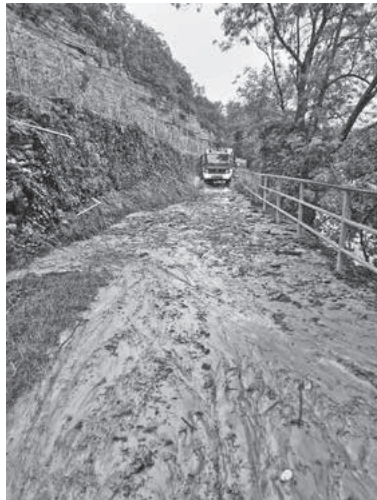
Starkregen am 17.06.2020 am Neckartalradweg mit starken Schlammablagerungen

Der genaue Ort und Zeitpunkt von Starkregen ist schwer vorhersagbar. Wo und wie viel es genau regnet, können Meteorologen nicht exakt