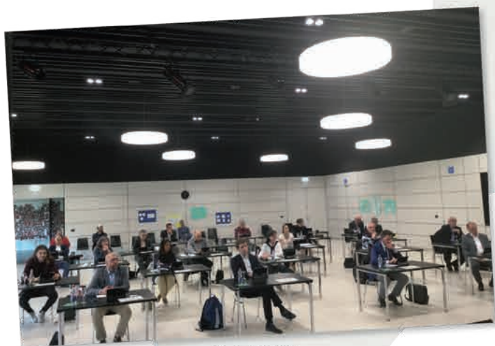
Sitzung des Gemeinderates am 15. April 2020

Gemeinderat – es muss viel entschieden werden, auch wenn man sich nicht oder nur unter erschwerten Bedingungen treffen kann. Die Gemeindeordnung für Baden-Württemberg sieht hierfür in einfachen Angelegenheiten das schriftliche Verfahren vor, die übrigen Tagesordnungspunkte, zum Beispiel Satzungsbeschlüsse erfolgten in der öffentlichen Sitzung des Gemeinderates vom 15. April 2020 in der Mensa des Schulzentrums. Den Sitzungsbericht können Sie dem Lauffener Boten der nächsten Woche entnehmen.