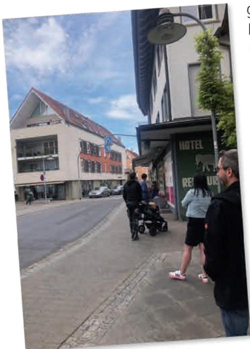
Korrekte Aufstellung vor der Metzgerei

Einzelhandel – seit Montag läuft in den Geschäften alles wieder (fast) in gewohnten Bahnen. Wir müssen mit dem Virus leben lernen, mit Disziplin und Verständnis.