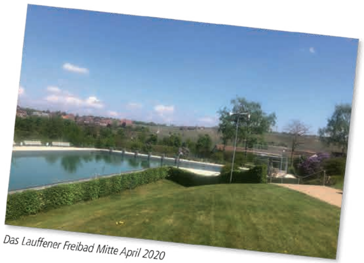
Das Lauffener Freibad Mitte April 2020

klären wir aktuell interkommunal und streben auch gemeinsame, einheitliche Lösungen für die Freibäder der Region an. Unser Freibadteam hat jedenfalls die erforderlichen Vorbereitungen für eine Inbetriebnahme getroffen und arbeitet jetzt im Bauhof und dem Ordnungsamt.