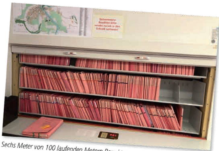
Sechs Meter von 100 laufenden Metern Bauakten

Seit Dienstag nutzt die Stadtverwaltung die freien Personalkapazitäten des Betreuungsbereiches für einen weiteren, gewaltigen Schritt in der Digitalisierung der Bürgerdienste. Das OnlineZugangsGesetz (OZG) wird bundesweit zahlreiche Verwaltungsleistungen digital zur Verfügung stellen, was passiert dann aber in den Verwaltungen? Es wird ausgedruckt und klassisch weiterbearbeitet, weil die erforderlichen Unterlagen noch nicht digital zur Verfügung stehen.