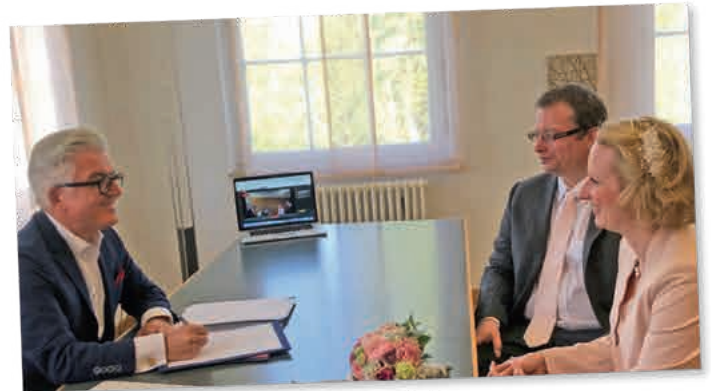
17. April 2020 – die erste Trauung mit Live-Schaltung

Die Zahl der Teilnehmer an Bestattungen und Trauungen ist extrem reduziert. Wir gehen wie in der Verordnung des Landes vorgegeben von 5 Personen aus, was für Trauernde eine gewaltige Einschränkung darstellt und auch dazu führt, dass sehr viele bereits terminierte Eheschließungen abgesagt werden. Der gerade im Trauerfall so wünschenswerte persönliche Kontakt kann nicht ersetzt werden. Den Eheschließenden bieten wir aber an, den im Trauzimmer anwesenden Personenkreis zu begrenzen und den Angehörigen die Möglichkeit zu geben, der Eheschließung live in einer Videoübertragung am Bildschirm zuhause oder auf dem mobilen Endgerät zu folgen.