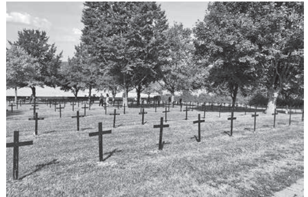
Die schwarzen Kreuze von Consenvoye

nächste Programmpunkt ganz gut – bei schönstem Sonnenschein eine Bootsfahrt durch Verdun und die Umgebung auf der Meuse, Stadtansichten vom Fluss aus sowie wunderbare Landschaften und auch eine handbetriebene Schleuse. Dann aber stand am nächsten Morgen schon die Rückfahrt nach Lauffen an. 20 Kilometer nördlich von Verdun hatte der Bürgermeister noch einen Zwischenstopp vorgesehen – der deutsche Soldatenfriedhof in Consenvoye, auf dem auch Francois Mitterand und Helmut Kohl bereits die gefallenen deutschen Soldaten ehrten. Etwa 11.000 Deutsche sind dort bestattet, so viele Menschen, wie unsere Stadt Einwohner hat und die Kreuze der Gefallenen sind nicht weiß sondern schwarz. Es ist Kriegsbrauch, den Gefallenen des Gegners eine Grabstätte nicht zu verweigern, der Friedhof sollte sich aber eindeutig unterscheiden – so kam man zu der Regelung mit schwarzen Kreuzen und Steinplatten. Damit es keine weißen und schwarzen Kreuze mehr braucht wurde der europäische Einigungsprozess eingeleitet, er hat zu einem Staatenbund