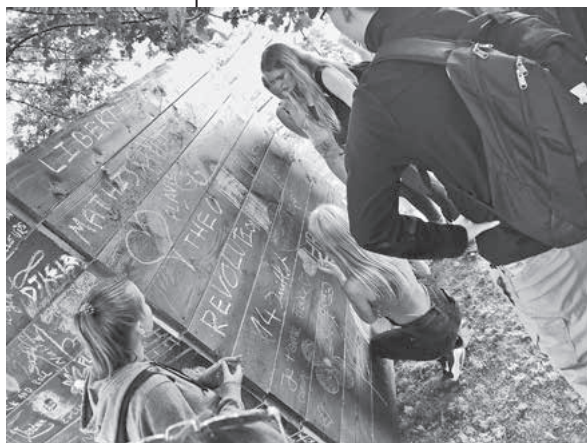
Lauffener für ein friedliches Europa – ein Kunstprojekt vor der Zitadelle von Verdun

Stauend standen die Jugendlichen vor den wuchtigen Denkmälern, die nicht-christlichen Glaubensangehörigen gewidmet sind, den jüdischen Kämpfern und den Soldaten mit muslimischem Glauben. Hebräische und arabische Schriftzeichen erinnern daran, dass zum Beispiel auch viele Menschen aus den nordafrikanischen französischen Kolonien in den Stellungskriegen vor Verdun starben –