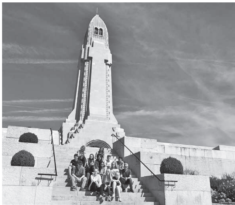
Die Exkursionsgruppe vor dem Beinhaus von Douaumont

Was hat dieser Krieg mit dem Europa unserer Tage zu tun, wie setzt man sich als Jugendlicher mit den Ursachen und den schrecklichen Folgen des Ersten Weltkrieges auseinander, kann man daraus für sich persönlich Schlüsse ziehen – diese Fragestellungen hatten die Mädchen und Jungen zu beantworten, eine Woche lang. Am Montag der Projektwoche Mitte Juli die Vorbereitung, von Dienstag bis Donnerstag die Fahrt ins Nachbarland und am letzten Projekttag dann die Vorbereitung auf den 17. November 2019. Dann wollen sie gemein-