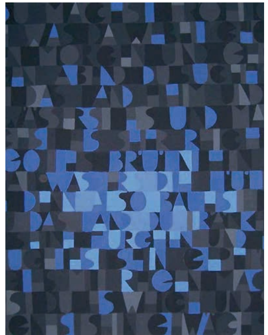
„Gottes Brunnlein hat Wasser die Fülle“ Psalm 65