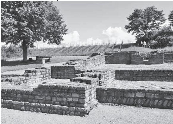
Foto: Birgit Nollenberger (Foto aus dem Wettbewerb zum Foto des Jahres 2018)

Führungen und Weinausschank am Römischer Gutshof in Lauffen a.N. an Christi Himmelfahrt und am 2. Juni 2019; Beginn der Führungen jeweils um 14 und um 14.45 Uhr