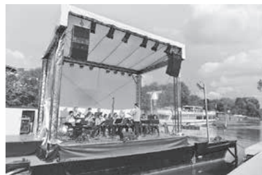
Auf der spannenden „Fährlehbühne“ auf dem Neckar stellte das Hobbyorchester der Lauffener Stadtkapelle ihr Können unter Beweis.

Auf geschlossene Reihen konnte das Fanfarenkorps Meimsheim zählen, das schmissig den Neckar-Zaber-Tag auf der Fährlehbühne eröffnete. Strahlender Sonnenschein begleitete die Start Ups der Stadtkapelle Lauffen und das Akkordeonorchester Brackenheim. Mit ihren eindrucksvollen Musikstücken zauberten sie gekonnt Sommerstimmung ans Neckarufer.