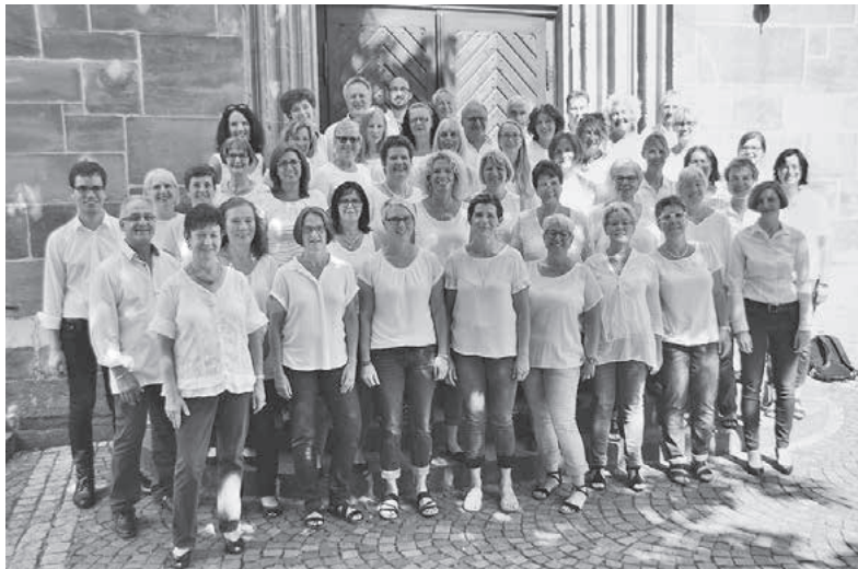
Der Lauffener Gospelchor JUST4YOU bereichert das Martinskirchenfest 2019 mit zwei Auftritten um 17 und um 19.30 Uhr in der Kirche.

Lauffener Gospelchor ist beim Martinskirchenfest gleich zwei Mal zu hören – Eintritt frei