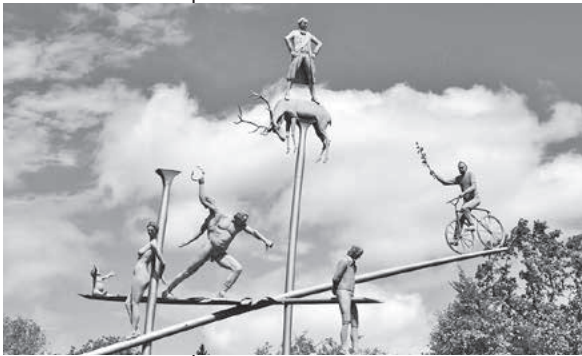
Foto: Ulrike Zimmer (Foto aus dem Wettbewerb zum Foto des Jahres 2018)

Hölderlin Führung am Samstag, 1. Juni um 14 Uhr