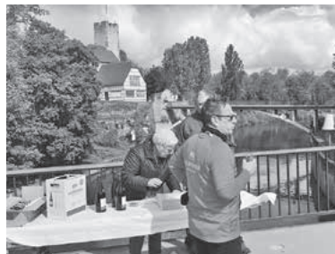
Auf der alten Brücke konnten sich die Läufer einen Schluck Trollinger genehmigen.