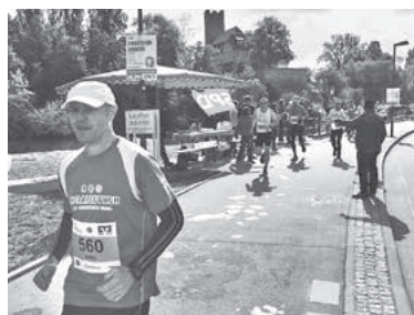
Der SPD Ortsverein Lauffen a.N. hat, wie auch schon in den Vorjahren, vor der Parkbucht am Kies eine Versorgungsstation betreut.