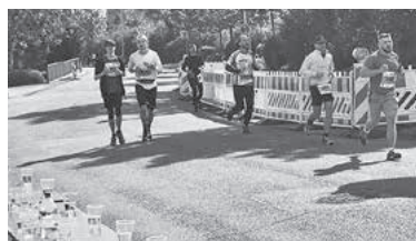
Die letzte Gelegenheit der Marathonteilnehmer, sich in Lauffen mit kühlem Nass zu erfrischen, war die Wasserstation an der Lauffener Weingärtnergenossenschaft.

Das Katzenbeißer-Team bestand in diesem Jahr aus 10 Marathon-, 43 Halbmarathon-, 12 Staffelläufern und 10 Walkern.