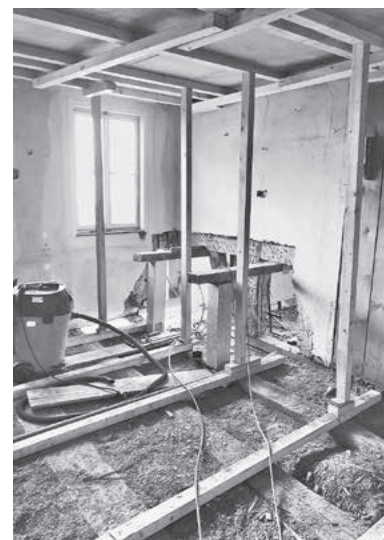
Sommerzimmer 1. DG