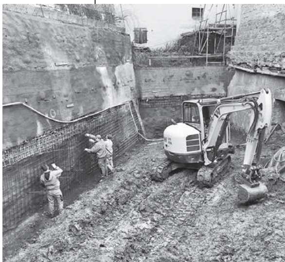
Tiefbau für Aufzugsturm

Der Weltgästeführertag am 2. März 2019 steht unter dem Motto „BAU-einHAUS“. Das Hölderlinjubiläum ist schon im kommenden Jahr!