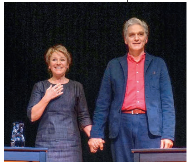
Mariele Millowitsch und Walter Sittler boten ein großartiges Schauspiel: Zwei Theaterprofis, die ihr Publikum die ganze Bandbreite menschlicher Gefühle durchleben ließen und es von der ersten Minute an fest im Griff hatten.

Das Geplauder, Geplänkel und Gestichel der beiden Ehe-Veteranen, ihre wechselweise monologisch und dialogisch vorgetragenen Erinnerungen, Lebensweisheiten und Altersgrübeleien lassen schmunzeln. Er ist genervt von seiner anstrengenden Kulturschaffenden, sie empört über die Selbstzufriedenheit des Kultur-