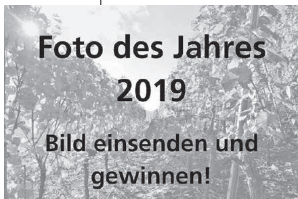
Foto des Jahres 2019 Aktion Foto des Jahres geht auch im Jahr 2019 weiter

Sie haben Spaß am Fotografieren und machen gerne Bilder von und an Ihrem Heimatort? Dann machen Sie mit beim Fotowettbewerb und senden uns Ihr Lieblingsfoto im Querformat ein.