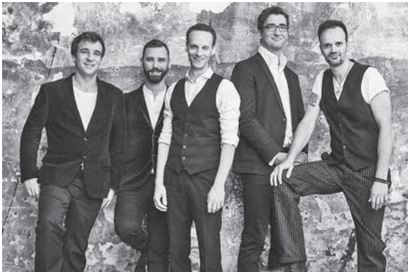
Vocaldente: Keep rollin'

internationalen A-Cappella-Festivals überall erste Preise ab – und werden sicher auch ihr Publikum in der Lauffener Stadthalle begeistern.