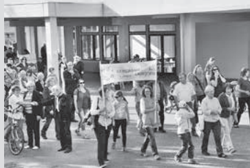
Impressionen aus 2014

Bereits zum vierten Mal nach 2012, 2014 und 2016 wollen Lauffener Bürger wieder ein Zeichen setzen für ein gutes Miteinander in der Stadt. Dafür wollen sie gemeinsam auf die Straße gehen. Am Tag der Deutschen Einheit, Mittwoch, 3. Oktober, startet um 14.30 Uhr am Marktplatz ein Marsch durch den Ort.