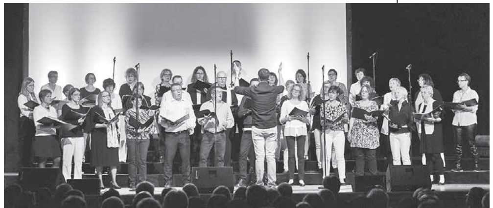
Der innovative Chor Young Chorporation freut sich auf den gemeinsamen Auftritt mit ONAIR.

Karten für diesen legendären Abend gibt es ab 21 Euro (ermäßigt 11 €) im Lauffener Bürgerbüro (Tel. 07133/20770) sowie unter www.lauffen.de . Eine Veranstaltung der Stadt Lauffen a.N. im Rahmen des städtischen Kulturprogramms „bühne frei...“ ■