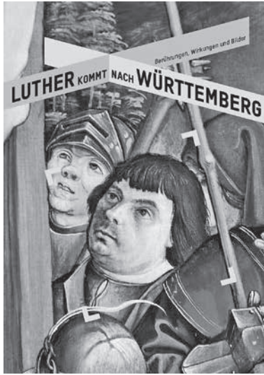
Traditioneller Biergenuss zur Ausstellungseröffnung: Die Jubiläumsausstellung der ev. Landeskirche zum Reformationsjubiläum wird am 10. September mit Lauffener „Craftbeer“ im Museum im Klosterhof eröffnet.

Am 10. September wird die Ausstellung „Luther kommt nach Württemberg“ im Museum im Klosterhof eröffnet