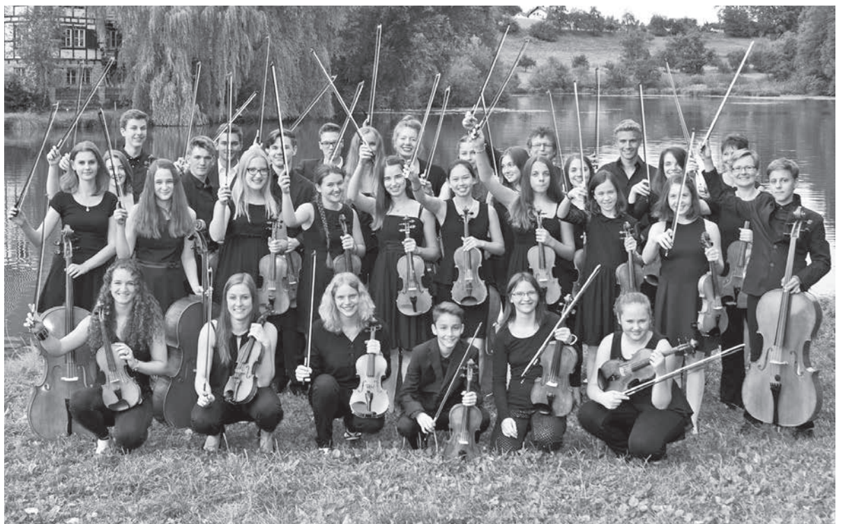
Die größten musikalischen Nachwuchstalente der ganzen Region Heilbronn, Tauber-Franken und Ludwigsburg präsentieren ihr Können.

Eintritt frei – um Spenden wird gebeten. Eine Veranstaltung der Stadt Lauffen a.N. und des JKO. ■