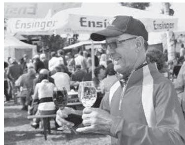
Für eine reichhaltige Weinauswahl sorgen fünf lokale Weingüter und die Lauffener Weingärtner eG im Lauffener Weindorf.

In der Weinstadt Lauffen a.N. darf natürlich das Thema Wein nicht fehlen. So haben sich fünf lokale Weinerzeuger sowie die Lauffener Weingärtner eG zusammengetan und präsentieren sich und ihre Produkte in einem kleinen Weindorf . Auf dem Gelände der Vinothek Lauffen schenken die Weingüter Hirschmüller, Hirth, Schaaf, Schiefer und Seybold sowie die Lauffener Weingärtner eG ihre feinsten Tropfen aus den Lauffener Weinlagen aus. Das Team der Vinothek Lauffen a.N. bietet alkoholfreie Getränke sowie Produkte der Destillerie Steng an.