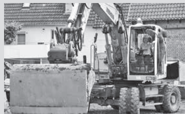
Pfarrerin Sybille Leiß beim Baggerbiss

Im hinteren Gebäude befindet sich ein ambulant betreutes Wohnangebot. Dort können in sechs Zwei-Zimmer Wohnungen Menschen mit Unterstützungsbedarf selbstständig mit zeitweiser Unterstützung leben. Mit einem stationären und ambulanten Wohnangebot unter einem Dach kann der Übergang zwischen beiden Wohnformen optimal gestaltet werden, zum Beispiel mit einer „Probewohnung“ im stationären Bereich. So werden die Bewohner schrittweise ans ambulant betreute Wohnen herangeführt.