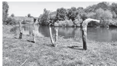
Die Treibhölzer sollen mit dem Team von „Kunst am Kies“ bunt gestaltet werden.

Hinter den After Work Sessions steckt die Idee, dass sich Vereine und Einrichtungen unserer Stadt an einem Abend präsentieren und den Gästen ein entspanntes Feierabendprogramm anbieten. Die Veranstaltungen sollen Treffpunkt für Lauffenerinnen und Lauffener sein, um sich auf das bevorstehende Wochenende einzustimmen und um die vielfältigen Angebote in der Stadt kennenzulernen.