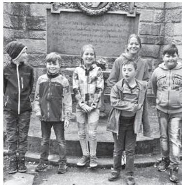
Schülerinnen und Schüler rezitieren ein Hölderlin-Gedicht vor dem Denkmal

Die beiden Kooperationsklassen, die Klasse 4a der Hölderlin-Grundschule zusammen mit der Klasse 4 der Kaywaldschule, Schule für Geistigbehinderte, besichtigen das Hölderlinhaus unter Führung des Architekten Till Läßle. In einer anschließenden praktischen Einheit werden sie Steine zerkleinern, daraus Farben gewinnen, um damit Farbstudien und anschließend ein Fassadenmodell des Hölderlinhauses zu bemalen.