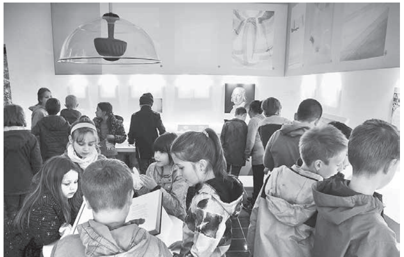
Schülerinnen und Schüler beim Besuch im Hölderlin-Zimmer im Museum