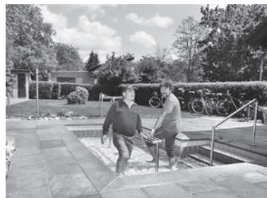
Der Kneippverein lädt zum Kneippen ein.

Die After Work Sessions finden immer freitags (außer in den Pfingstferien) um 18 Uhr auf dem Kiesplatz statt. Den Sommer über steht dort eine Bühne, auf der die Gäste mit einem vielfältigen Programm begrüßt werden.