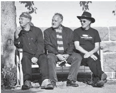
Grachmusikoff kehren vor ihrer „Rente“ nochmals zurück nach Lauffen a.N.

Am Wochenende 17./18. Juni ist wieder was los in Lauffen a.N., die Vereine und Einrichtungen der Stadt präsentieren das Brückenfest links und rechts des Neckars. Das Festgelände erstreckt sich von der Rathausinsel durchs Städtle, über die Alte Neckarbrücke, entlang der Ufer- und Kiesstraße bis zum Kiesplatz. Dabei findet sicherlich jeder, von Jung bis Alt, das passende Angebot.