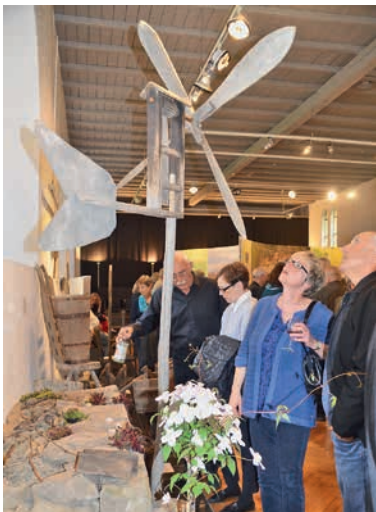
Eindrucksvolle Exponate entführen die Ausstellungsbesucher in die Welt der Weinberge.

Alles Wissenswerte rund um die historischen Terrassenweinberge ist noch bis 27. August im Museum zu erfahren