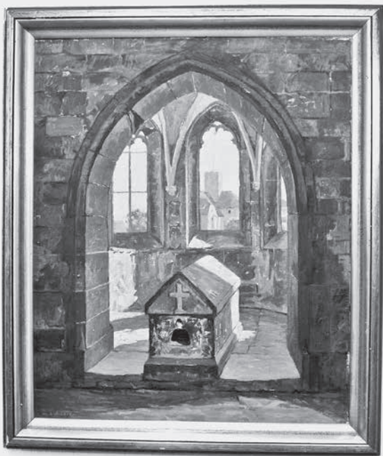
Maler: Andresen

Die Teilnahme an der Führung kostet für Erwachsene 5 €, Kinder sind frei. Treffpunkt ist am Samstag, 20. Mai, um 18 Uhr, an der Regiswindiskirche, Kirchbergstr. 16., 74348 Lauffen. Informationen bei Hartmut Wilhelm, Telefon 07133/5869 bzw. info@suedbuch.de . ■