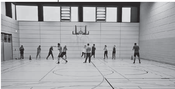
Box-AG der Hölderlin-Werkrealschule.