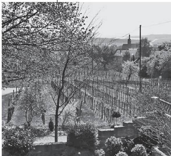
So schön ist der Ausblick vom Gästehaus Kraft, Träger des neuen Gütesiegels „Empfohlenes Weinhotel Baden-Württemberg“, durch die Lauffener Weinberge auf die Neckarstadt.

Lauffener Betrieb erhält neues Gütesiegel bereits in der ersten Auszeichnungsrunde