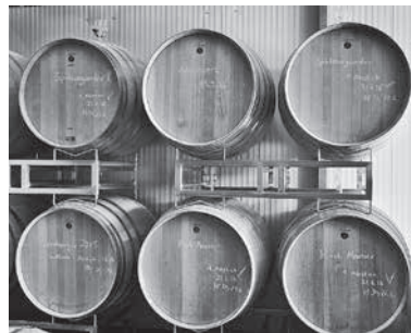
Traubenreife im traditionellen Eichenfass im Wein- und Sektgut Hirschmüller.

Besonders ist beim Weingut Hirschmüller auch die Weiterverarbeitung. Mit einer traditionellen Korbpresse werden hier die Trauben gepresst. Der Ertrag ist hierbei zwar niedriger, die Qualität jedoch höher, da dieses Pressverfahren schonender ist, als die herkömmliche maschinelle Verarbeitung. Der Wein reift dann im traditionellen Eichenfass. „Durch die Röstung des Holzes entstehen hier ganz besondere Aromen, die in den Wein eingebunden werden“, meint Wiebke Krüger.