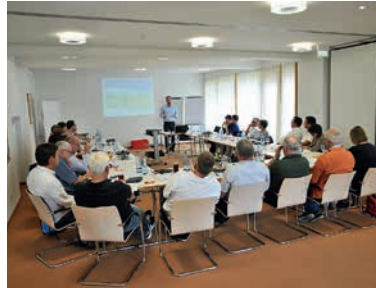
Intensive Arbeitsatmosphäre bei der Klausurtagung

Quartier konnten die Räte einige neue Eindrücke und Impressionen, auch für die Gestaltung des Hölderlinhauses, sammeln.