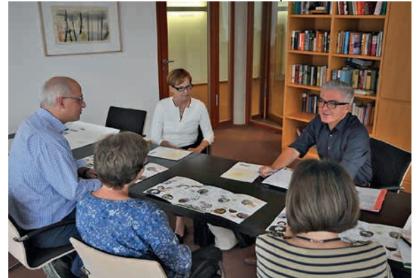
Arbeit in Kleingruppen