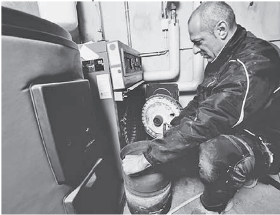
Wann eine alte Ölheizung oder Gasheizung ausgetauscht werden muss, ist in der Energieeinsparverordnung festgeschrieben