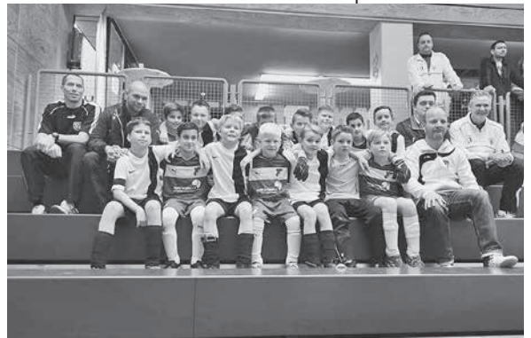
Gespannt wird der kommende Gegner beobachtet

Die Jugendabteilung der Sportfreunde lädt interessierte Zuschauer herzlich zum Anfeuern und zur Unterstützung der Nachwuchs-Fußballer ein. Für eine angemessene Bewirtung ist gesorgt. ■