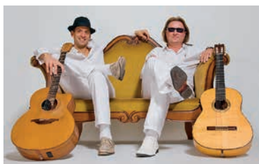
Das Duo Magic acoustic Guitars sorgt am Samstag mit einem Mix aus Swing, Flamenco, Pop, Jazz, Blues und Latin für die musikalische Umräumung.

Am Samstag und Montag können die Besucher ab 17 Uhr die Stimmung im Lauffener Burghof genießen. Am Sonntag heißen die Veranstalter die Besucher bereits um 11 Uhr willkommen.