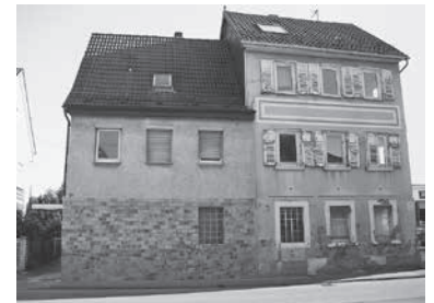
Die Gebäude in der Kiesstraße mit den Nummern 8 und 10 werden abgerissen.

Die betroffenen Grundstücke und Gebäude westlich der Tankstelle Knödler sind im Eigentum der Stadt Lauffen am Neckar. Der Abriss der Gebäude dient zur Schaffung von Freiräumen, die es der Stadt ermöglichen, nördlich der Kiesstraße übergangsweise Parkmöglichkeiten anbieten zu können.