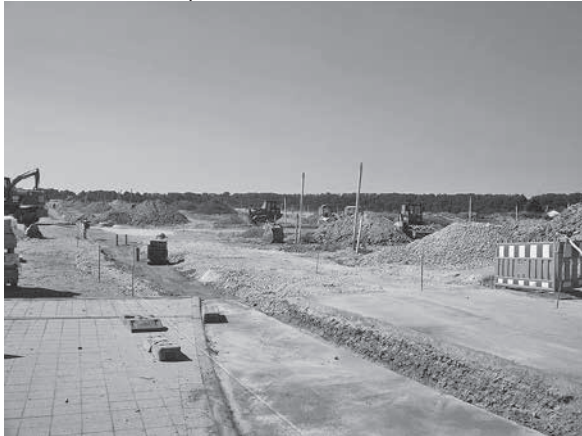
Blick von der verbreiterten Schillerstraße ins Baugebiet.

Im Süden der Stadt Lauffen entsteht momentan das circa 5 Hektar große Baugebiet „Obere Seugen“. Dort wird gerade fleißig gebaggert, vermessen und Kanäle angelegt.