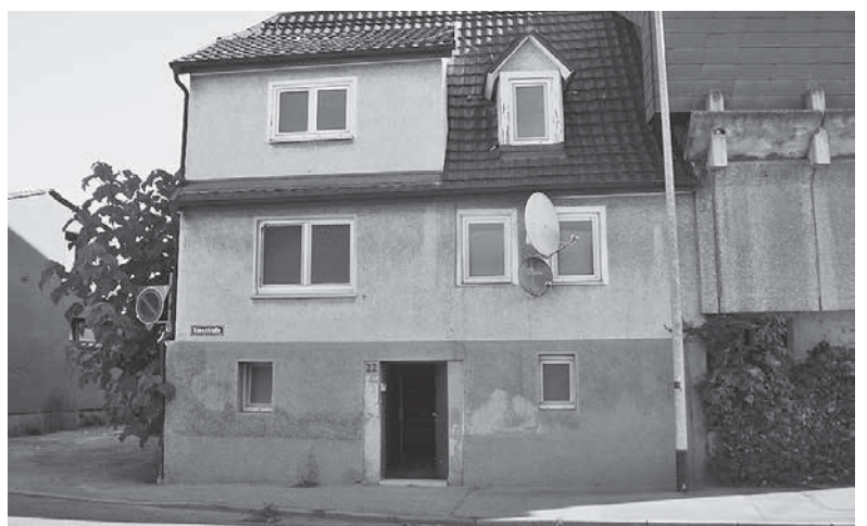
Die Abbrucharbeiten westlich des Kiesplatzes enden vorerst mit dem Gebäude Nr. 22.

Da direkt entlang der Kiesstraße gearbeitet wird, wird es durch die Maßnahme zeitweise zu Einschränkungen im Straßenverkehr kommen. Die Stadtverwaltung bittet hierfür um Ihr Verständnis. ■