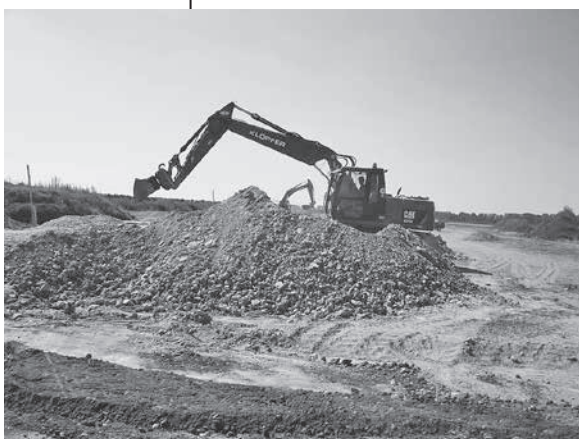
Viele Arbeiter sind mit großen Geräten im Einsatz, um rasch voran zu kommen.

Haben Sie sich bei einem Spaziergang rund um das Baugebiet bereits gefragt, was die vielen rot und blau markierten Pfosten bedeuten, die über die gesamte Baustelle verteilt sind? Es handelt sich hierbei um Markierungen für Regenwasser- (blau) und Abwasserkanäle (rot).