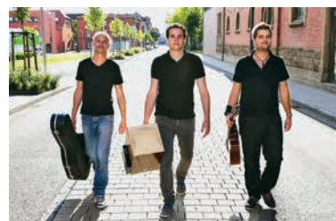
Die Inselneulinge, die Band Line in, nimmt ihre Zuhörer am Montag mit auf einer erfrischenden Reise durch zahlreiche Zeiten und Stilrichtungen.

sang in Verbindung mit einer Cajon. Mit unvergessenen Perlen der Musikgeschichte aus Rock-Pop- und Folkklassikern nehmen sie ihre Zuhörer mit auf eine erfrischend neue Reise durch zahlreiche Zeiten und Stilrichtungen. Mit im Gepäck haben die Drei Balladen und groovige Kultsongs unter anderem von Simon and Garfunkel, Dire Straits, Billy Joel bis hin zu aktuellen Hits von Pharell Williams und Robin Thicke.