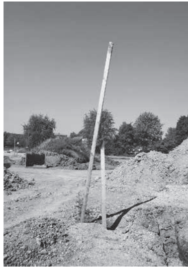
Markierungen für Regenwasser- und Abwasserkanäle

Bau Ihres Häuschens in idyllischer Südlage loslegen.