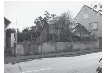
Auch der Schuppen mit der Hausnummer 14 wird abgebrochen.

Die Abbrucharbeiten werden von einem Fachunternehmen vorgenommen. Es ist geplant, die Arbeiten so emissionsarm wie möglich auszuführen. Die Zufahrt zur Tankstelle Knödler mit zugehöriger Kfz-Werkstatt wird auch während der Abbrucharbeiten möglich sein.