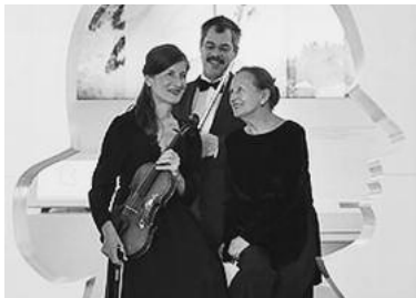
Ein Benefizkonzert unter dem Thema „Diotima – Licht der Liebe“ feiert Friedrich Hölderlin zu seinem Geburtstag am 20. März.