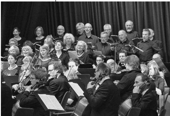
Großer Chor, Orchester und Solisten präsentieren Bachs Meisterwerk am Palmsonntag.

Chor der Regiswindiskirche & Projektsänger musizieren mit Orchester und Solisten am Palmsonntag