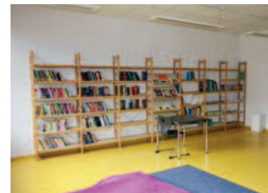
Bibliothek mit jugendgerechten Büchern und Magazinen.

An Tagen, an denen kein Nachmittagsunterricht stattfindet, können die Schülerinnen und Schüler ihrer Freizeit selbst in dafür geschaffenen Räumen, wie der Spielothek, der Bibliothek, der Mediathek sowie dem Aufenthaltsraum, gestalten. Die Räume sowie die Freiflächen für Sport und Bewegung sind betreut, bzw. von einem Lehrer beaufsichtigt.