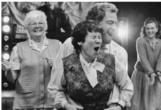
Liebenswerte britische Komödie. Witzig, herzerwärmend, politisch.