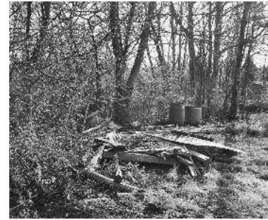
Missstände an der Zaber

Am Dienstag, 08.04.2014, fand die diesjährige Gewässerschau an der Zaber statt, wobei der Abschnitt von der Einmündung der Zaber in den Neckar bis zur Lauerbrücke begangen wurde. Trotz anfänglichem Regen nahmen zahlreiche interessierte Eigentümer von Zabergrundstücken, Behördenvertreter sowie Vertreter der Naturschutzverbände an der Begehung teil.