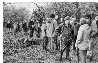
Gut besuchte Gewässerschau

Bemängelt wurden hier insbesondere unzulässige Gehölzablagerungen im Böschungsbereich, Verbauungen am Uferstrand und Kompostablagerungen direkt am Gewässerrand bzw. an der Uferböschung. Die Eigentümer bzw. Pächter der betroffenen Grundstücke werden gebeten, die Missstände zeitnah zu beseitigen.